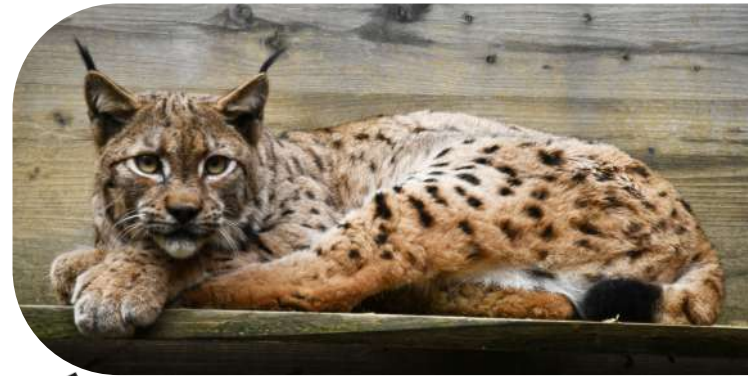
Le lynx de Montceaux en convalescence

qui nous permet, après échanges préalables avec l'Office Français de la Biodiversité et les services préfectoraux pour jauger la situation, de pouvoir intervenir rapidement. Sur votre secteur, nous nous étions déjà rendus sur place 2 fois suite à des signalements, avant que le propriétaire de l'exploitation nous rappelle pour nous indiquer la présence du lynx sur son terrain ; nous avons pu l'anesthésier à distance et le ramener ensuite au centre. »