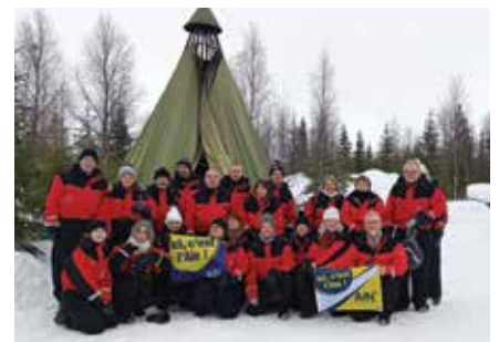
Les conscrits 68tard - Manziat - Laponie - Finlande