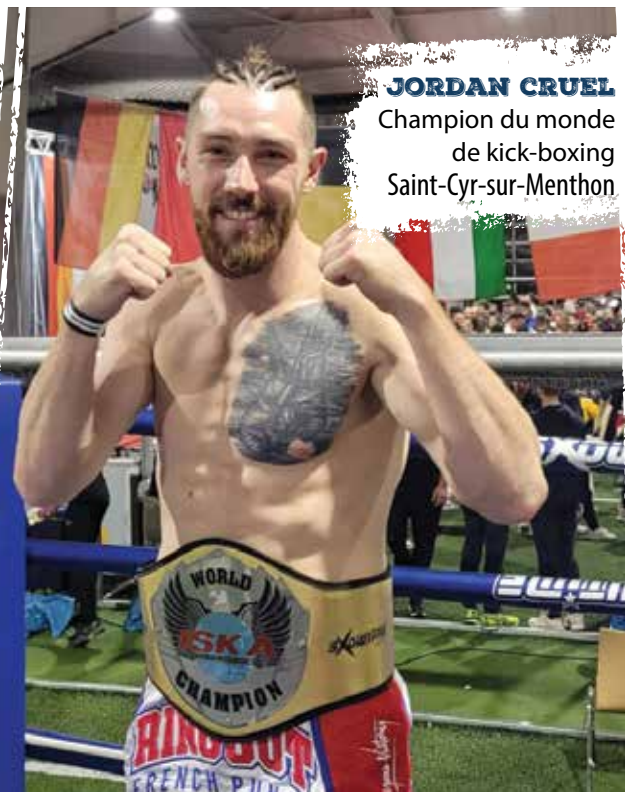
JORDAN CRUEL Champion du monde de kick-boxing Saint-Cyr-sur-Menthon