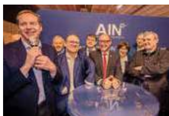
Christian Prudhomme, Georges Blanc et Laurent Gerra toujours fidèles à leur département de cœur.